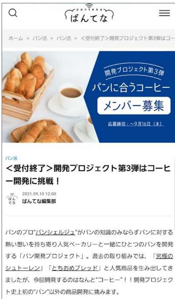
プロジェクト告知&参加者募集画面