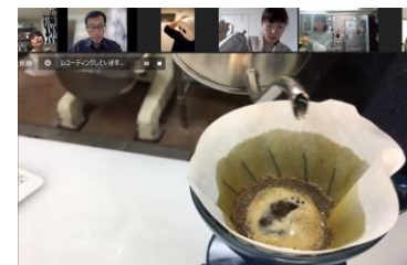
開発したコーヒーを使った ハンドドリップ講座も実施