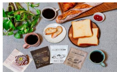
実際に開発したオリジナルコーヒー